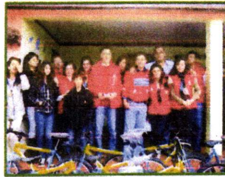
Entrega de Bicicletas a la Institución Educativa Municipal CORREGIMIENTO SAN ANTONIO DE ACUYUYO