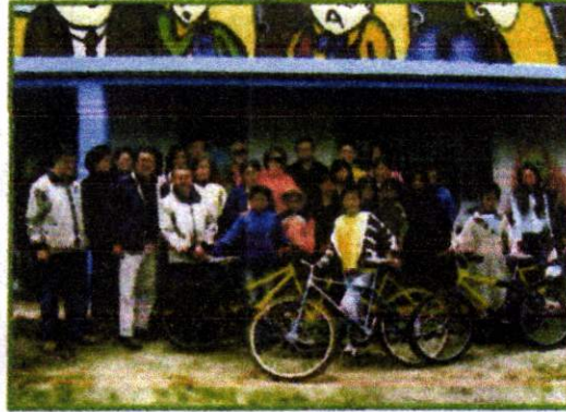
Entrega de Bicicletas a la Institución Educativa Municipal CORREGIMIENTO SANTA MARÍA