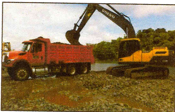
Retroexcavadoras – Pajarito: