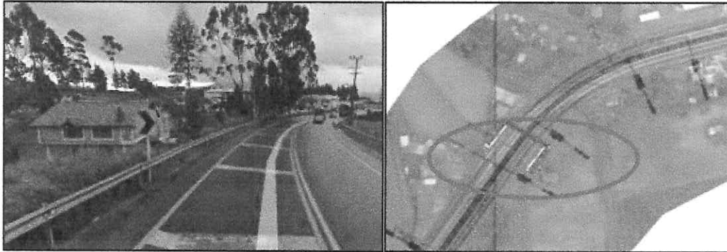
Puente peatonal Bavaria - Unidad funcional 5.1 en el Pk 31+300