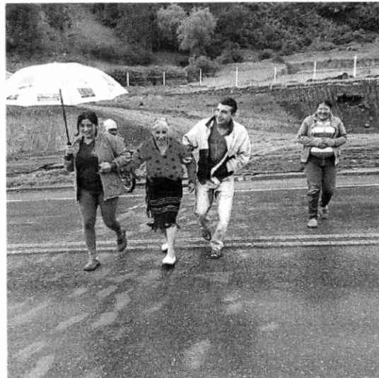
Paso de peatones (Adultos mayores, niños, adultos, y personas con limitación en la movilidad )

H/A Publico: Lunes a Viernes 8:00 a.m. a 12:00 m y 2:00 p.m. a 6:00 p.m.