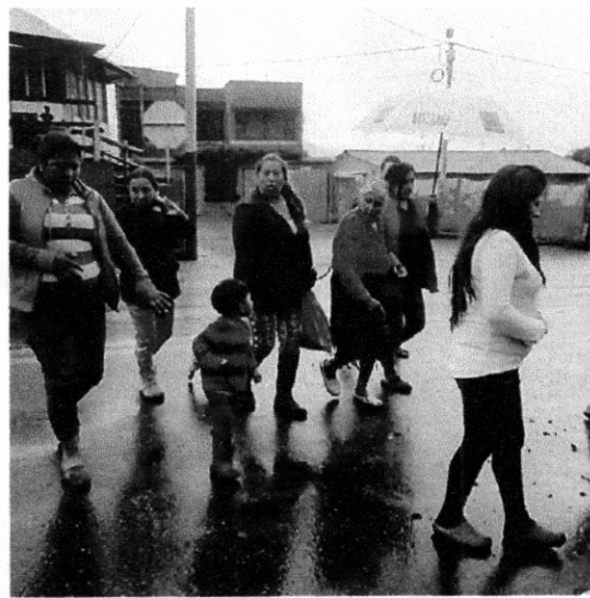
Comunidad del sector quienes transitan frecuentemente (Adultos mayores, niños, adultos, y personas con limitación en la movilidad )