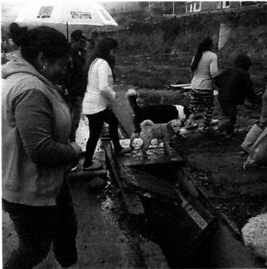
Dificultad de acceso de la comunidad de las diferentes veredas que comprenden el sector.