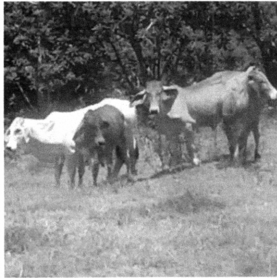
Sector agropecuario y lechero, represado por el peligro que representa la velocidad de los vehículos y la dificultad para su comercialización y extracción de los productos