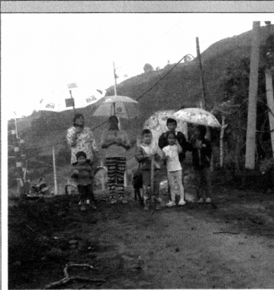
Comunidad del Sector Barrio Corazón de Jesús, vereda Cebadal y Buena esperanza quienes se les dificulta el paso por la Doble calzada