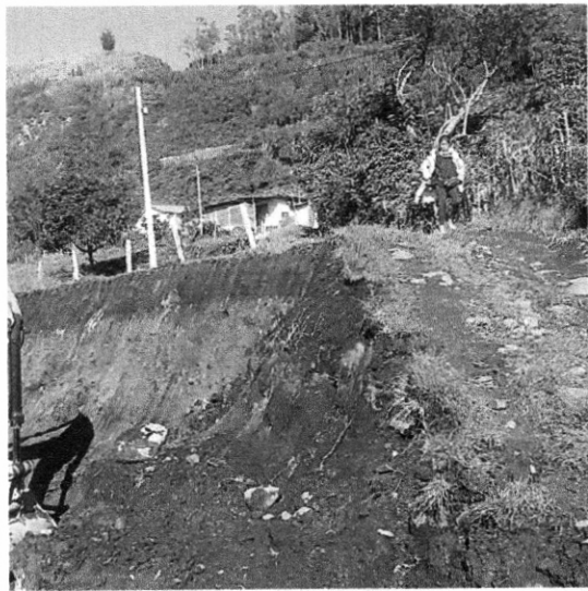
Dificultad paso peatonal (Adultos mayores, niños, adultos, y personas con limitación en la movilidad) lo que impide el desplazamiento a las diferentes actividades que se realizan en el Municipio de Tangua y capital del Departamento, además de la atención requerida por la comunidad en la Empresa Social de Estado (E.S.E.)