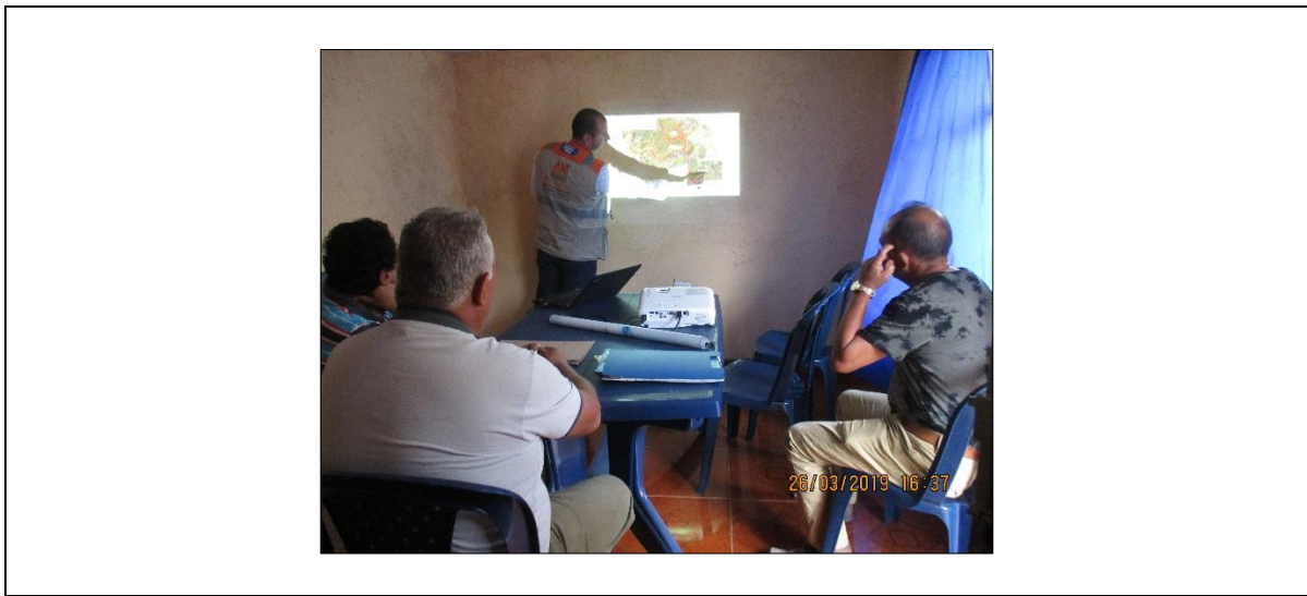
Socialización del cambio menor de la instalación y operación temporal de las trituradoras móviles con representantes de la Junta de Acción Comunal de El Pedregal y un representante de la Asociación de vivienda El Chirimoyal.