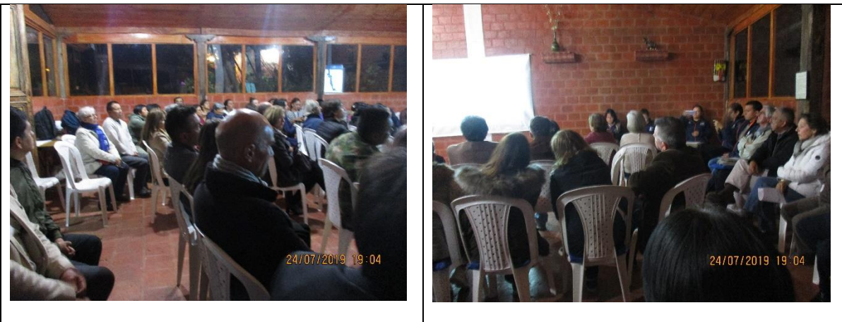
Socialización sobre la intervención predial y el diseño del acceso a la Parcelación Campestre La Estancia, Santa Isabel – El Troje y otras.