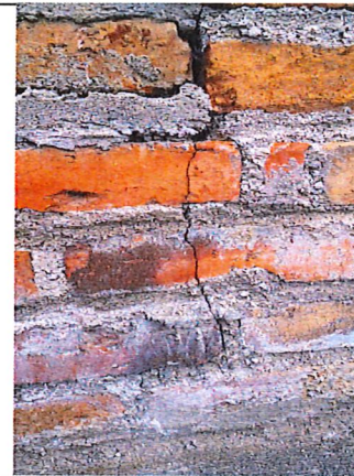
Detalle de la fisura a reparar.