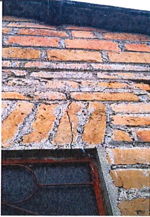
Se realiza registro fotografico a la afectación a reparar, al cual es una fisura longitudinal en la fachada lateral derecha.