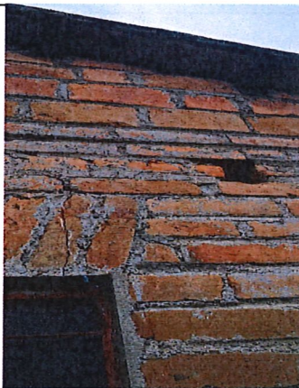
Detalle de la fisura a reparar.