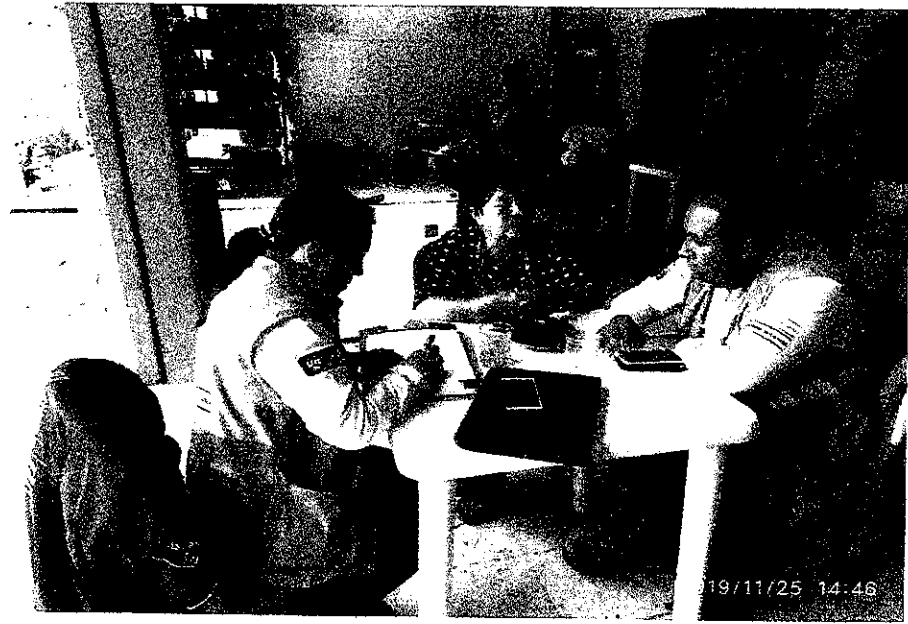
Reunión el día 25 de noviembre de 2019 con representante de la Junta Administradora de Acueducto de Río Téllez

Permanezcan en confianza que el Concesionario goza de la mejor disposición para atender a las comunidades beneficiarias del Proyecto y en la aclaración de sus inquietudes