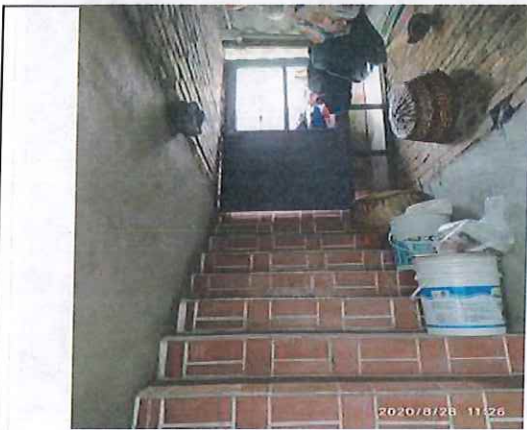
Escalera de acceso a terraza, se presentan en buenas condiciones. En muro lateral izquierdo se observa fisura