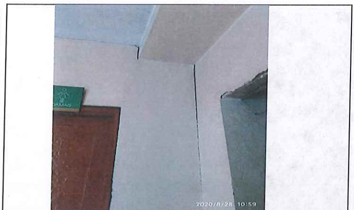
Grieta en muros frontales de comedor los cuales comparte con baño de damas