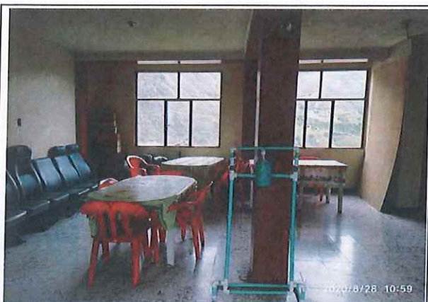
Comedor en primer nivel de vivienda, cuenta con piso enchapado en baldosa, se presenta de manera general con desgaste y piezas con fisuras