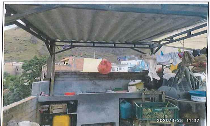
Zona de lavado ubicada en terraza, lavadero presenta fisuras. Cubierta en tejas de fibrocemento en óptimas condiciones