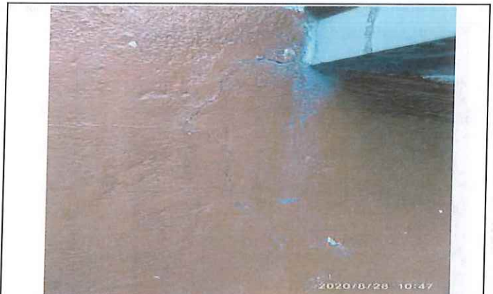
Fisura en muro de fachada frontal en primer nivel de la vivienda desde dintel de ventana ubicada en costado izquierdo