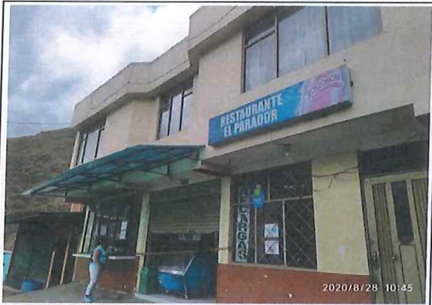
Fachada frontal de la vivienda

(registrar Fachada, acceso, pisos, muros, techo, cocina, baño, patio y demás elementos críticos que a futuro deban ser registrados)