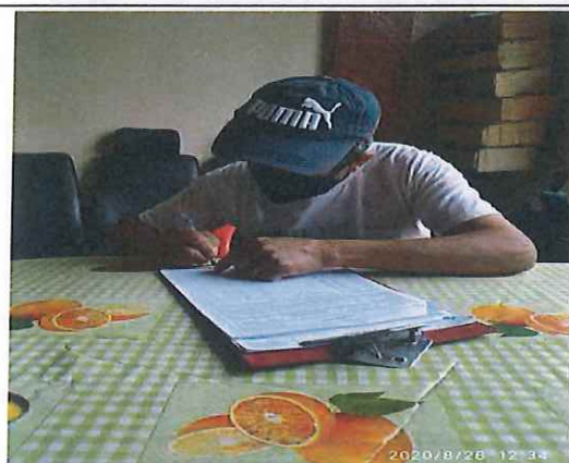
Firma de acta de seguimiento por parte del propietario de la vivienda