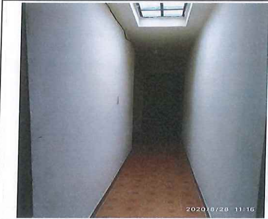
Pasillo en segundo nivel de vivienda, se aprecia muros, piso y cubierta en buen estado

(registrar Fachada, acceso, pisos, muros, techo, cocina, baño, patio y demás elementos críticos que a futuro deban ser registrados)