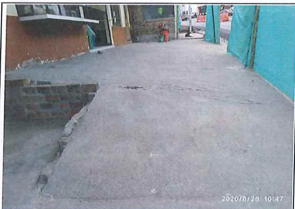
Andén o patio frontal, se presenta con múltiples fisuras y grietas