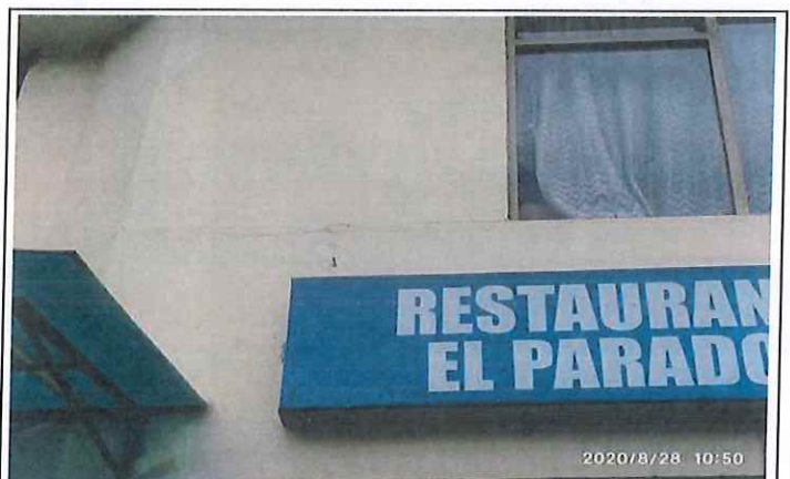
Fisuras en muros de fachada frontal en segundo nivel de la vivienda