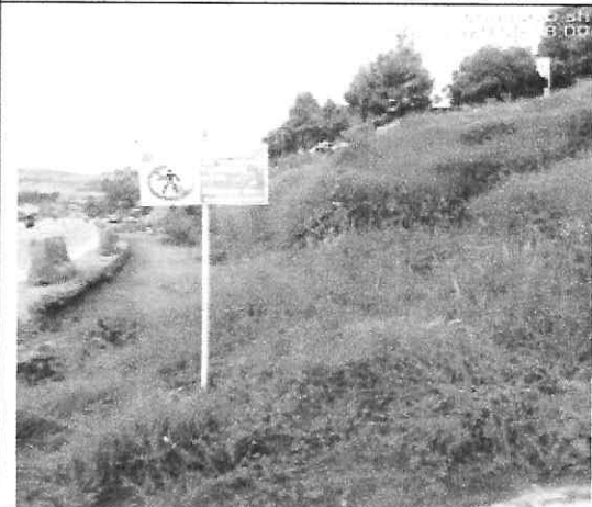
Instalacion de señal industrial prohibido el ingreso a personal no autorizado