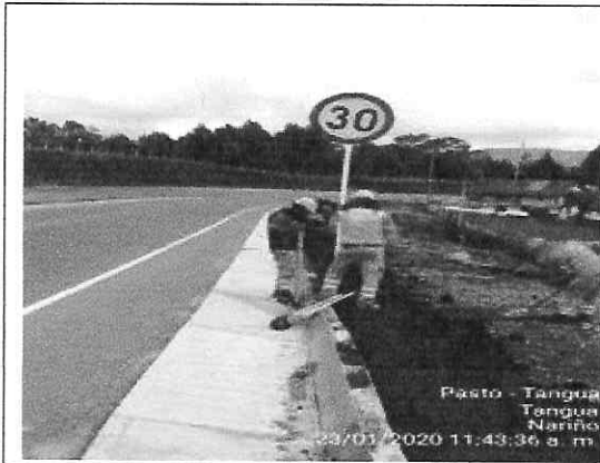
Instalacion de señal reglamentaria SR-30-30 velocidad maxima permitia