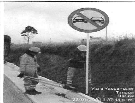
Instalacion de señal reglamentaria sr-26 prohibido adelantar