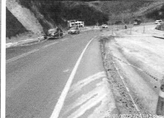
Delimitacion de obra con delineadores tubulares y cinta de oeligro como tambien señalización horizontal