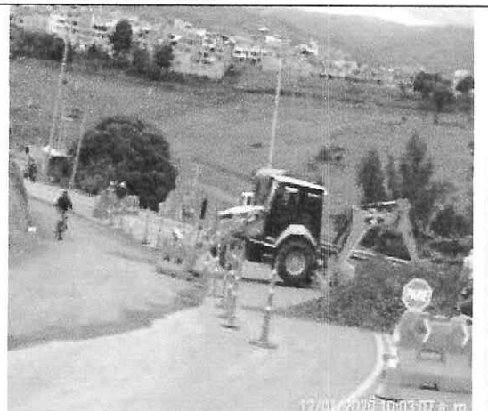
Ciclista sin elementos de proteccion