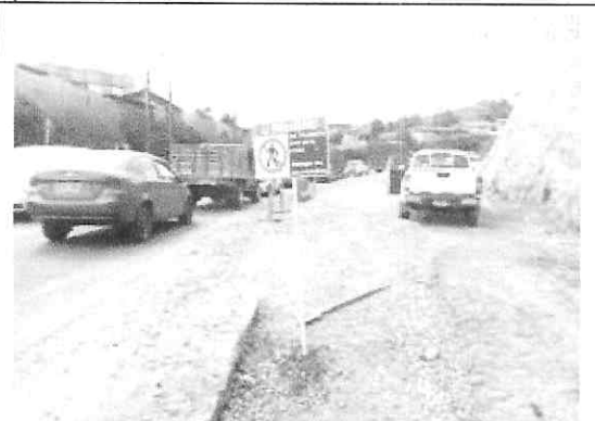
Instalacion de señal industrial prohibido el ingreso a personal no autorizado