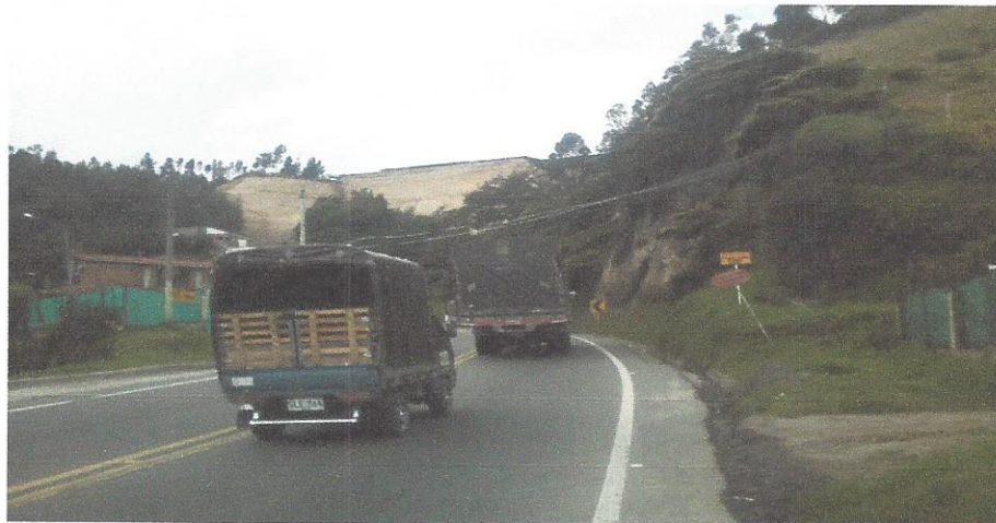
TRAYECTO REQUERIDO 18 mts.