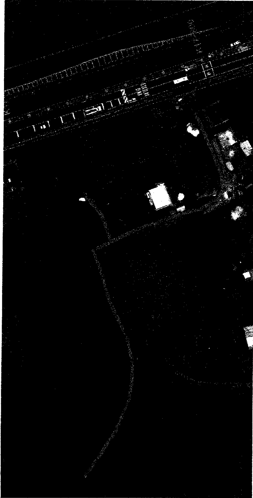
Figura 1 Ubicación de la tubería existente para trazado de Alcantarillado (únicamente esquemático)