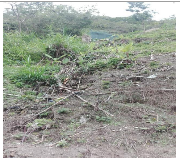
Descripción: Vista del estado del talud después de la alcantarilla, tomada desde la vía que conduce a Guapacal.