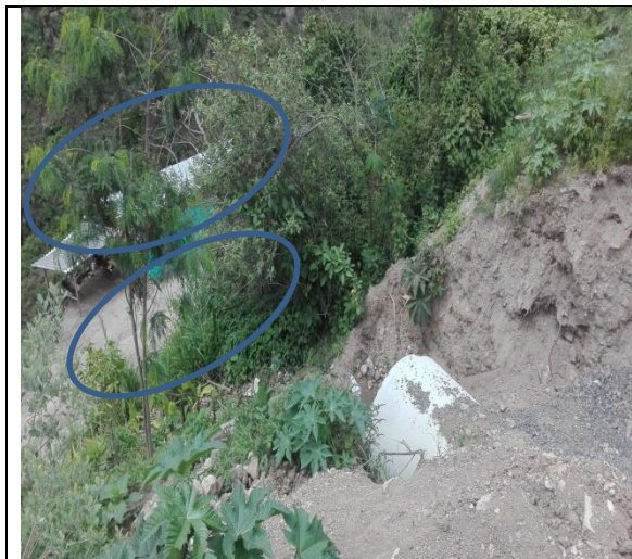
Descripción: Alcantarilla – PK 4+370 – y en la parte posterior de se encuentra ubicada la vivienda en la que habita el señor Azael y la vía que conduce a Guapacal