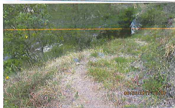
Sendero peatonal de acceso al predio caracterizado por estar ubicado en una ladera difícil de transitar.