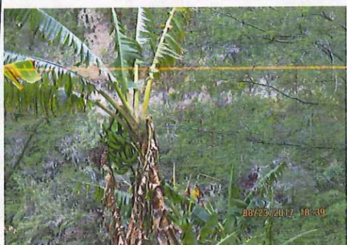
En el predio se observan algunos cultivos de banano con frutos y otros sin carga.