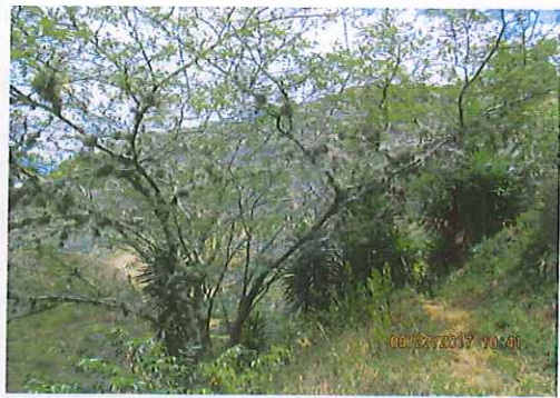
Se observan varios arboles de musgo.

(registrar Fachada, acceso, pisos, muros, techo, cocina, baño, patio y demás elementos críticos que a futuro deban ser registrados)