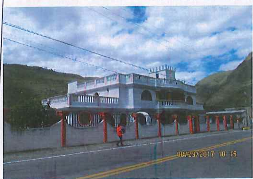
Vivienda en venta parcial, a la cual se le hizo levantamiento de acta de vecindad solo al predio posterior donde se ubican cultivos.

(registrar Fachada, acceso, pisos, muros, techo, cocina, baño, patio y demás elementos críticos que a futuro deban ser registrados)