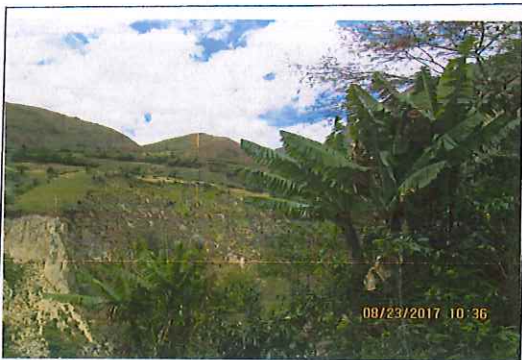
Cultivos de plátano con poca carga y unos con frutos secos.