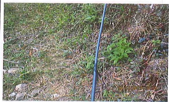
Manguera plástica de alimentación a sistema de riego, en malas condiciones y con reparaciones artesanales.