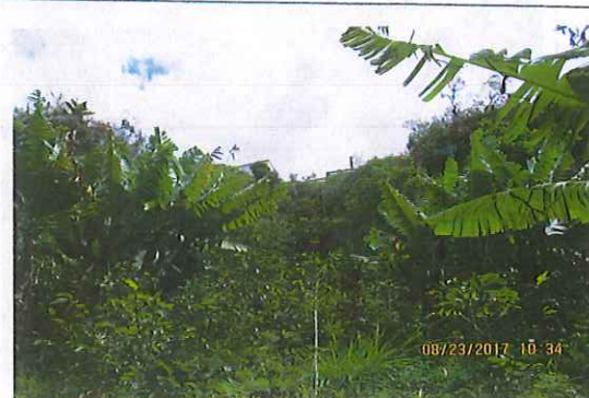
Predio con vegetación variable, que incluye cultivos de café, banano y plátano.