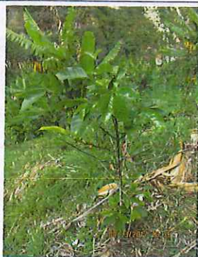
Mata de café con poca carga.