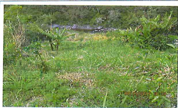
La mayor parte del predio consta de vegetación sin cultivos ni frutos considerables.