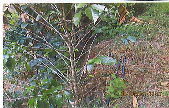
La mayoría de las matas de café se observan si carga.