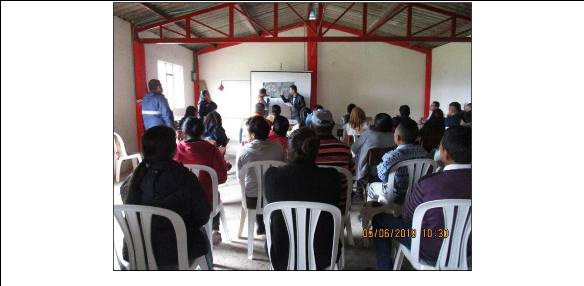
Se socializa a la comunidad de El Vergel el detalle del diseño de la Alternativa N° 2 en relación a los tramos encausados con tubería, canales, estructuras hidráulicas como cunetas, disipadores, etc., en función de las pendientes existentes y su utilidad.