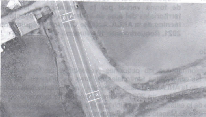
Acceso viejo- Vereda Chávez

Ahora bien, en cuanto al retorno de interés, es preciso resaltar que, las obras del corredor Rumichaca - Pasto permiten reducciones en tiempo y costos de desplazamiento significativas para los usuarios del corredor vial y el departamento de Nariño. Sin embargo, por las características propias de una doble calzada, los cambios de sentido son definidos en puntos estratégicos, para la mayoría de usuarios de la vía, generando infraestructura adecuada y suficiente para realizar la maniobra de cambio de sentido en condiciones seguras: