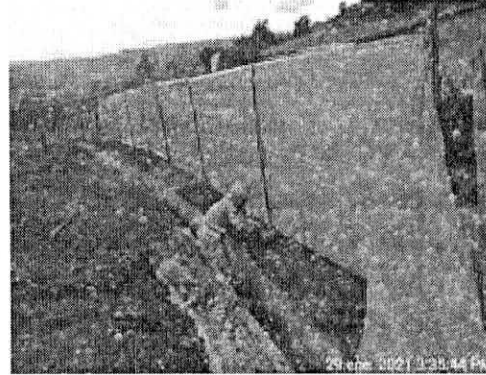
Descripción: Cierre con polisombra a Vivienda cercana Fecha: 30/01/2021