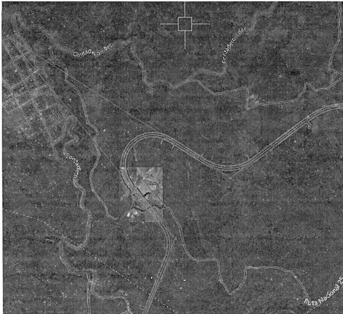
Imagen No. 2

Así las cosas, la solución de movilidad en este sector, es mejorada considerablemente con la proyección de los caminos interconectados, manteniendo así, la conexión de este camino veredal y la conexión con la doble calzada, garantizando el enlace entre los diferentes caminos y accesos veredales del sector de la referencia, tal como puede ser visualizado en la siguiente imagen: