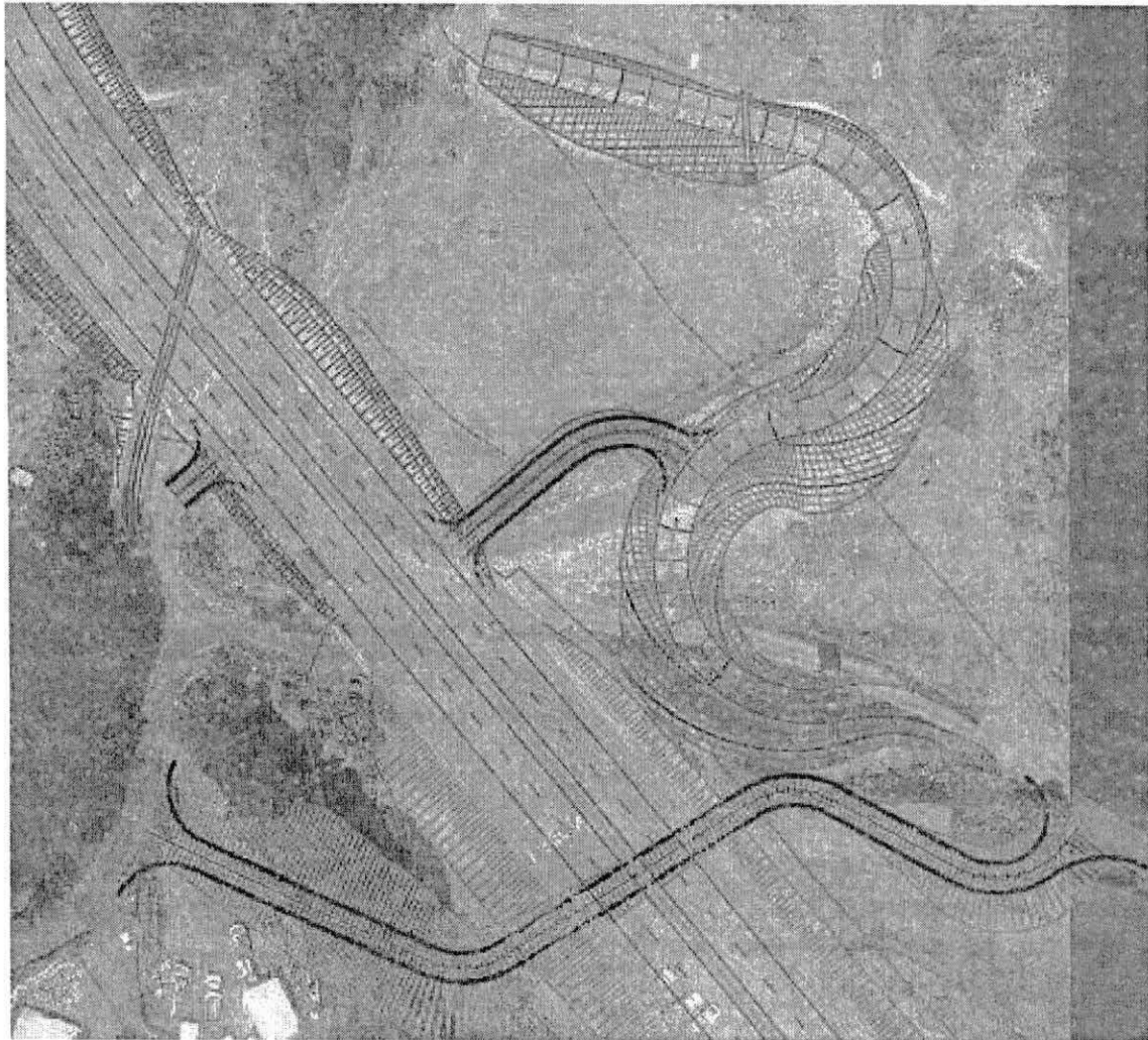
Imagen No. 1

Es importante informarle también, que los caminos de acceso a la doble calzada y, el camino paso a bajo nivel, están conectados; mejorando desde dicha conexión totalmente la movilidad del sector, pues ahora existe una interconexión directa entre las veredas y una interconexión directa de las veredas con la doble calzada Rumichaca – Pasto, tal como se puede visualizar en la siguiente imagen: