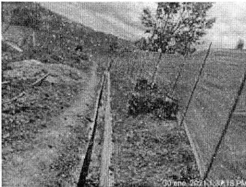
Descripción: Cierre con polisombra a Vivienda cercana Fecha: 30/01/2021

Conforme el OCTAVO (8) PUNTO , informamos que, en la actualidad, dentro de la zona de influencia directa de los cortes, ha sido iniciada la instalación de POLISOMBRA, ello, con el fin de proteger a las viviendas y a los cultivos cercanos de la generación de material particulado, por lo cual, en los próximos días, será continuada la realización de estas actividades en mención, dentro de los lugares que lo requieran y se vean directamente afectados.