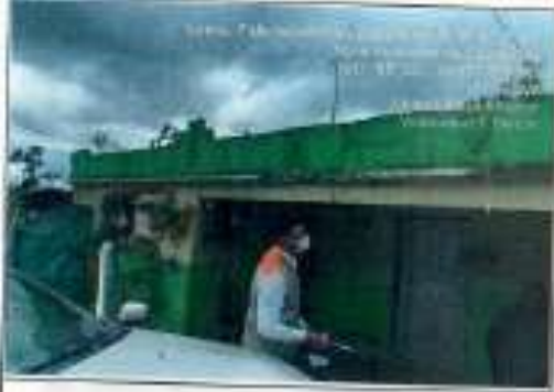
Identificación de Fachaada frontal de la vivienda.