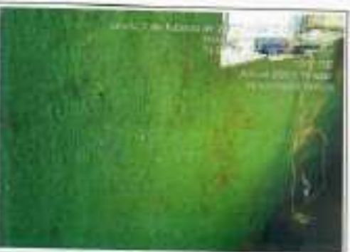
Habitación 1: se refiere agrietamiento en línea lateral izquierdo en borde inferior de ventana.