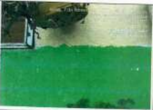
Fachada frontal: se refiere grieta transversal en borde inferior derecho de ventana, esto es en el costado lateral izquierdo.