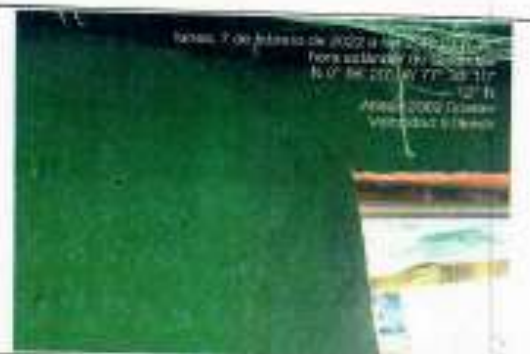
Habitación 1: en muro frontal borde superior izquierdo se refiere fisura en rejilla.