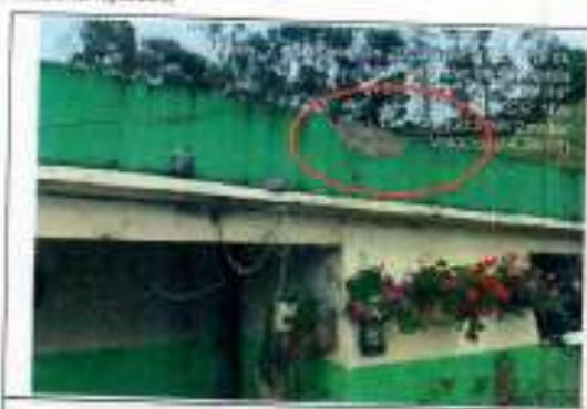
Fachada frontal: se refiere deterioramiento de unidades de ladrillo y rejilla en la zona superior.