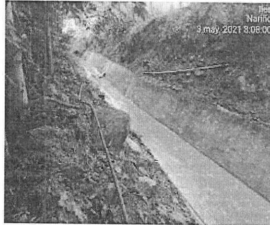
2021-05-03 Revisión estado de manguera de riego - se encuentra operativa.

En ese entendido y, de conformidad con lo descrito, se ha procedido a dar trámite de fondo a la petición por usted elevada, recordándole, que puede permanecer en confianza de que el Concesionario Constructor y la Concesionaria Vial, están a disposición de atender cada uno de sus requerimientos en los términos y las condiciones establecidos en la normatividad aplicable a la materia.