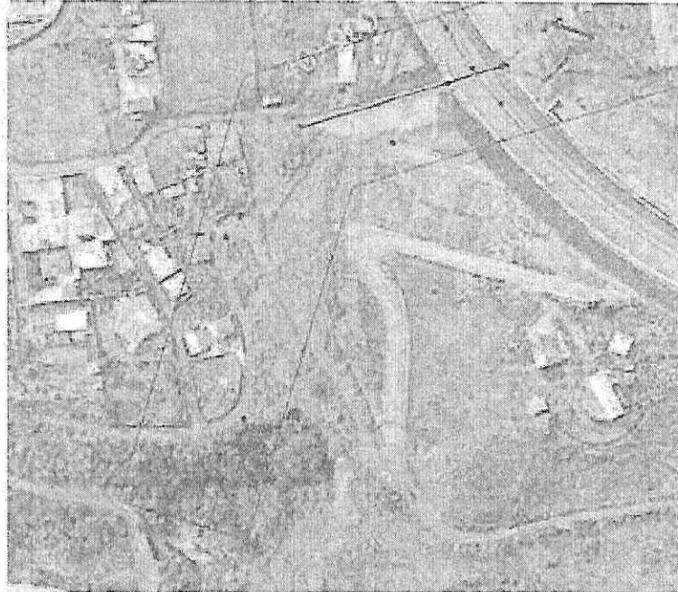
Ilustración 1: Localización descole en alcantarilla sector Porvenir.

Pronunciamento frente a las peticiones No. 2 “(...) Arreglo de las vías de la Urbanización El Porvenir y de la vía de acceso a la vereda, mediante la colocación, extendido y compactación de material granular, el cual fue arrastrado por las aguas que descarga la alcantarilla y las vías destruidas. (...)” y 3 “(...) Realizar una visita ocular a las viviendas afectadas y determinar los daños ocasionados. (...)”: