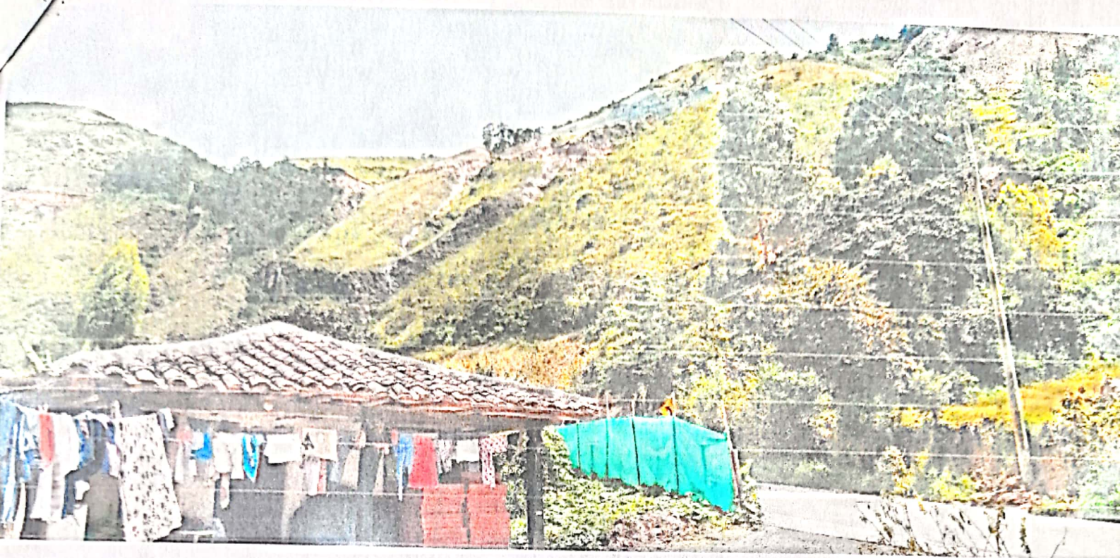
Imagen 6 vista desde abajo: Otra de las casas que se verá afectada.