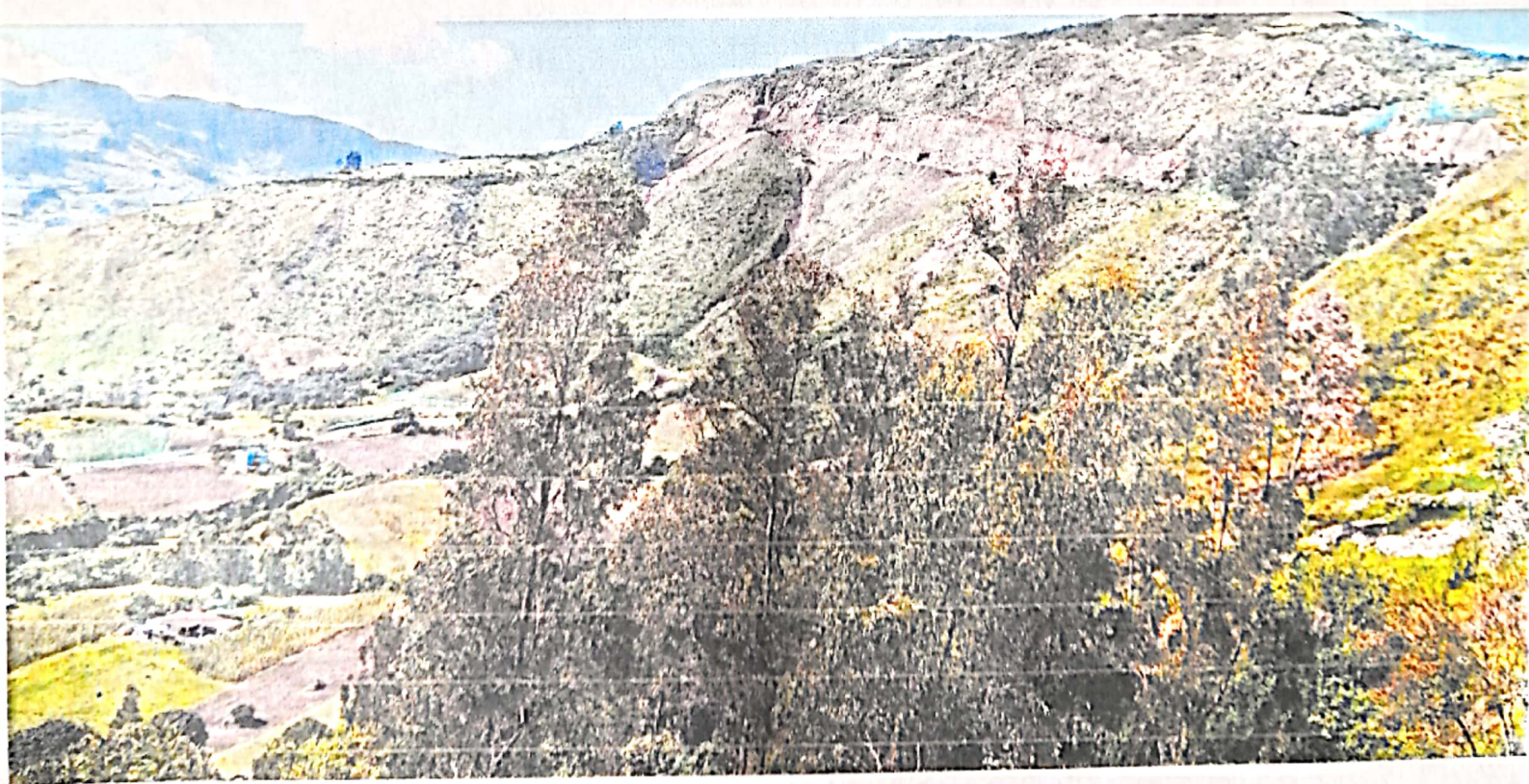
Imagen 4: Trabajos de la doble calzada de los cortes 222, 223 y 224 en la vereda Tablón