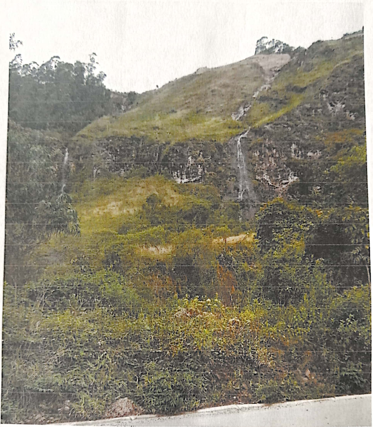
Imagen 8: Vista más cerca de las chorreras donde debería enviarse el agua de alcantarillado de la doble carretera para evitar inundaciones.