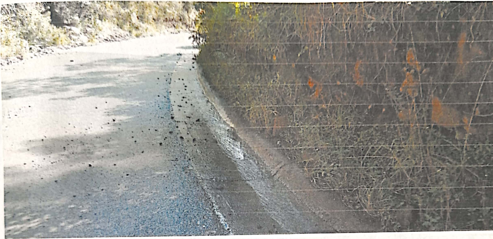
Imagen 11: Actualmente, el agua de la doble calzada, está bajando por la carretera que va al municipio de Iles.