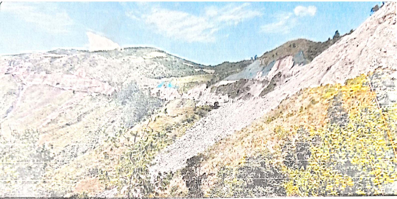
Imagen 3: Trabajos de la doble calzada en los cortes 222, 223, 224 y 225 en la vereda Tablón bajo