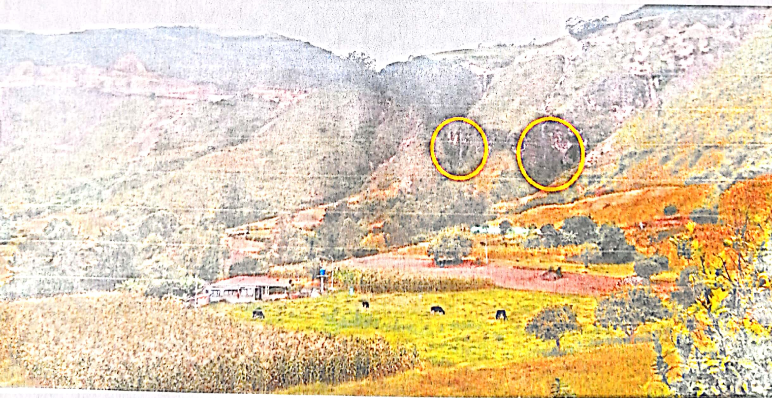
Imagen 7: Chorreras donde debería enviarse el agua de alcantarillado de la doble calzada para evitar inundaciones.