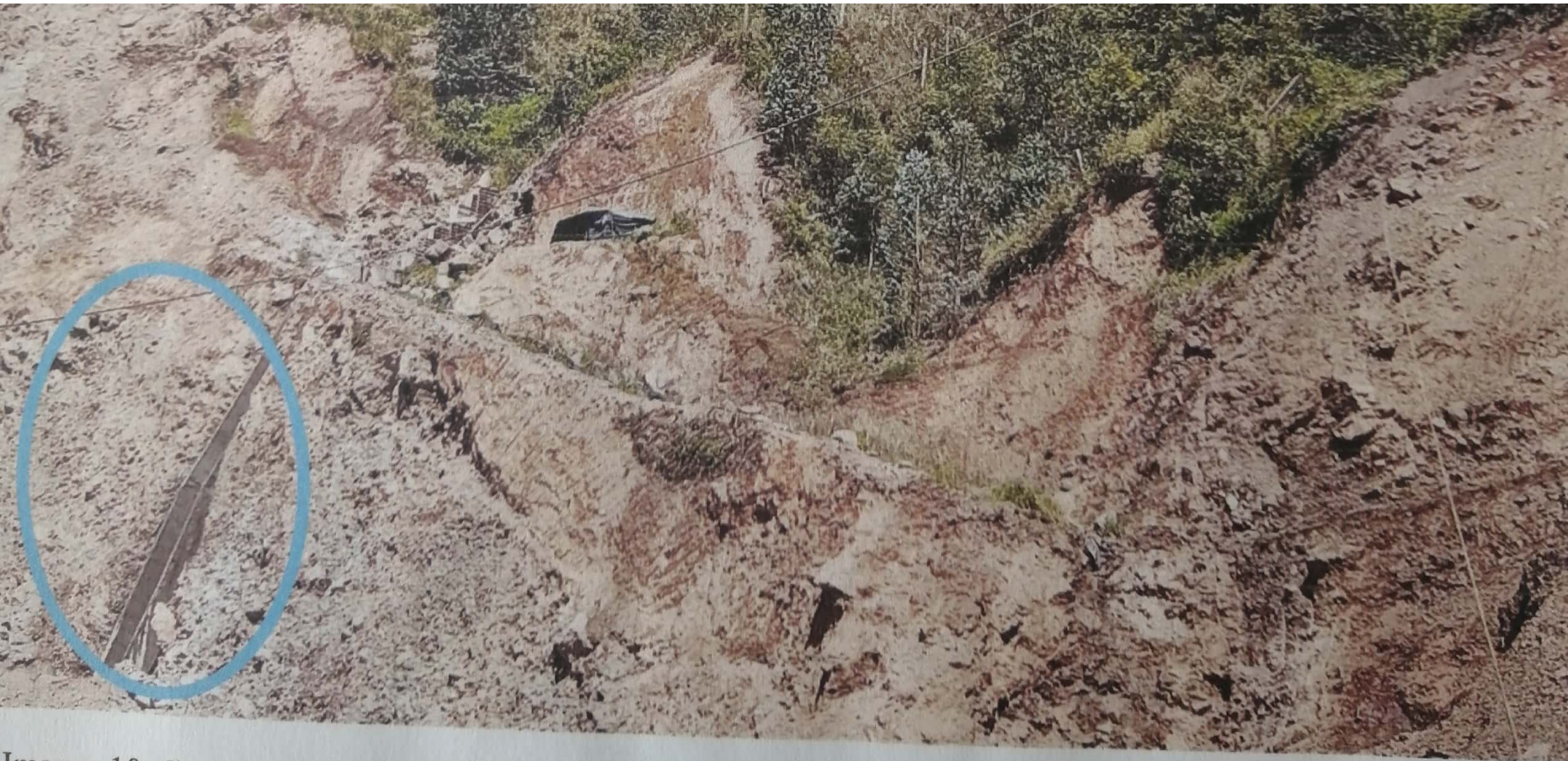
Imagen 10. C