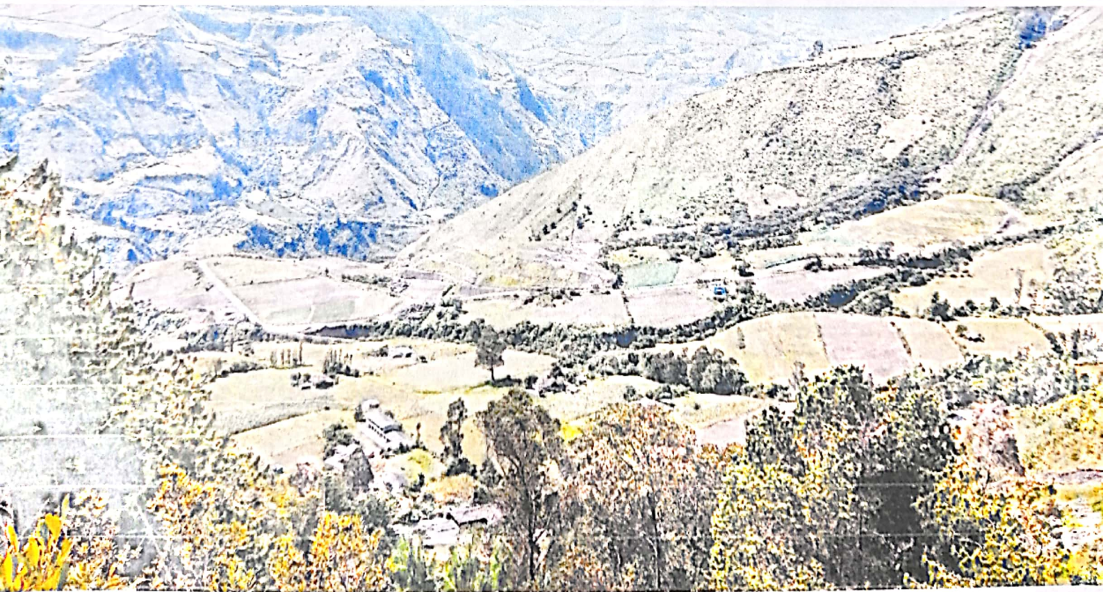
Imagen 2: Vereda Tablón bajo