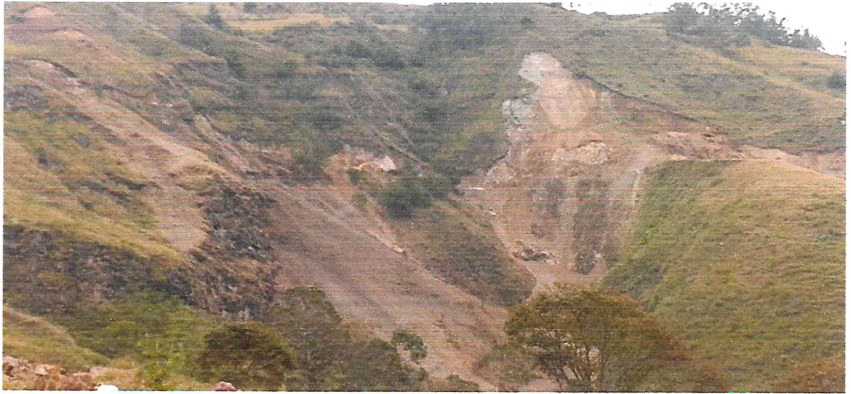
Visión panorámica de la afectación