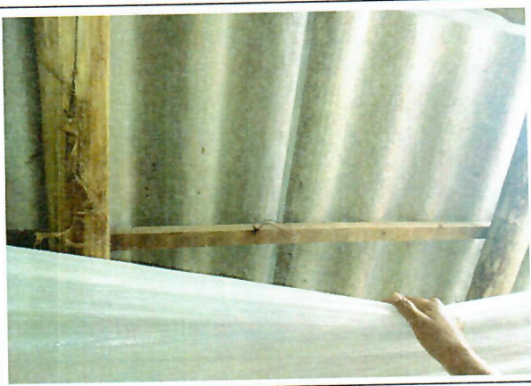
Tejas de fibrocemento instaladas recientemente para reparar otros daños en área de cubierta de galpón

(registrar Fachada, acceso, pisos, muros, techo, cocina, baño, patio y demás elementos críticos que a futuro deban ser registrados)