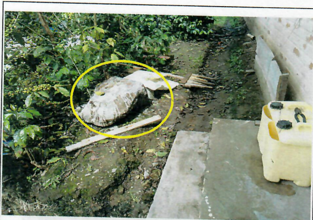
Roca que cayó al interior del predio afectando cubierta y parte de una viga y una columna del galpón