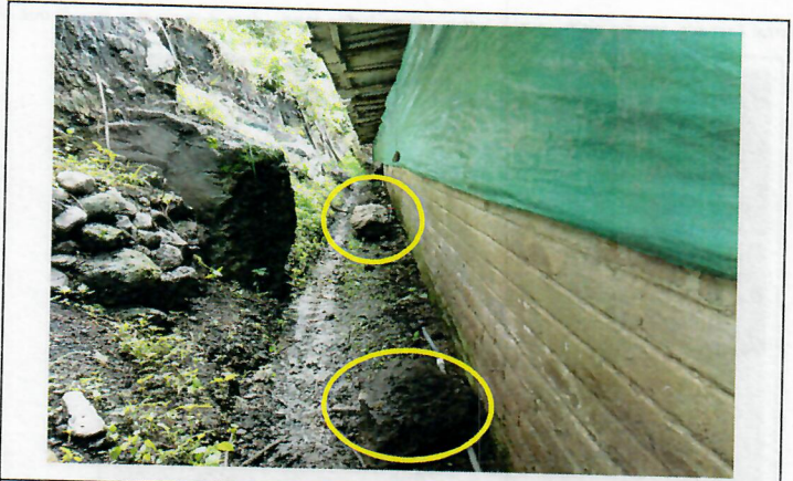
Rocas que cayeron al interior del predio según refiere administrador, afectando parte de la cubierta del galpón