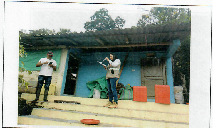
Fachada de galpón afectado por la caída de rocas