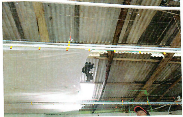
Tubería para bebedero de nipple que según refiere el administrador también fue reparado por parte de la propietaria