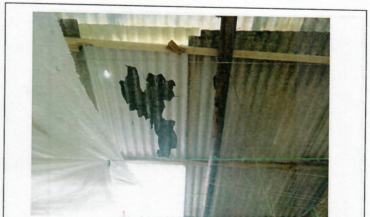
Hoja de policarbonato de cubierta con fracturas, por esta parte fue por donde entro la roca que afecto además parte de viga y columna