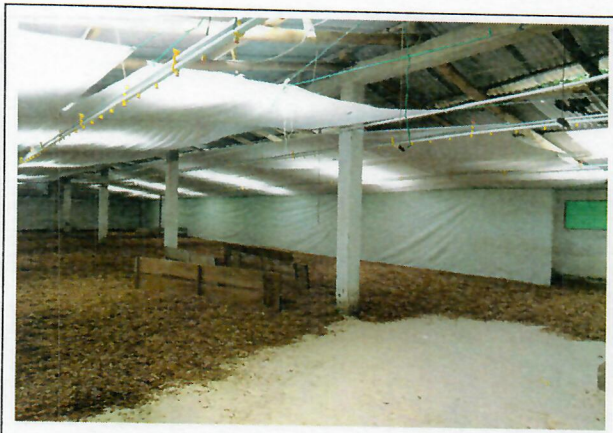
Parte interna del galpón afectado