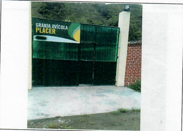
Fachada frontal de instalaciones de granja avícola el placer

(registrar Fachada, acceso, pisos, muros, techo, cocina, baño, patio y demás elementos críticos que a futuro deban ser registrados)