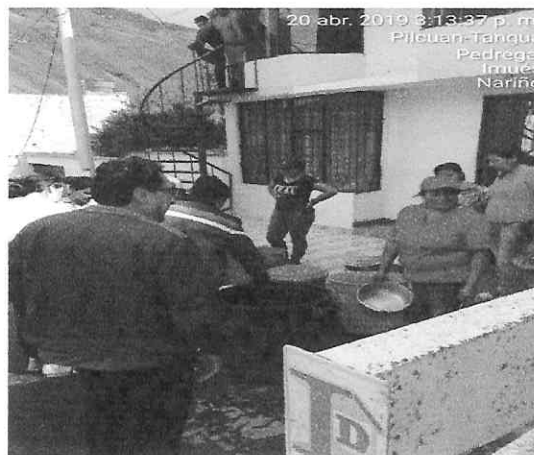
Fotografías 1 y 2: Distribución de agua mediante carro tanque- Sector la Urbanización Pedregal