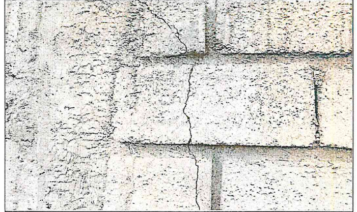
Fisura en el muro frontal del cerramiento, ubicada al costado derecho. El propietario manifiesta que fue una volqueta la que ocasiono el daño.