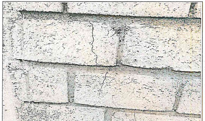
Fisura en el muro frontal del cerramiento, ubicada al costado derecho. El propietario manifiesta que fue una volqueta la que ocasiono el daño.