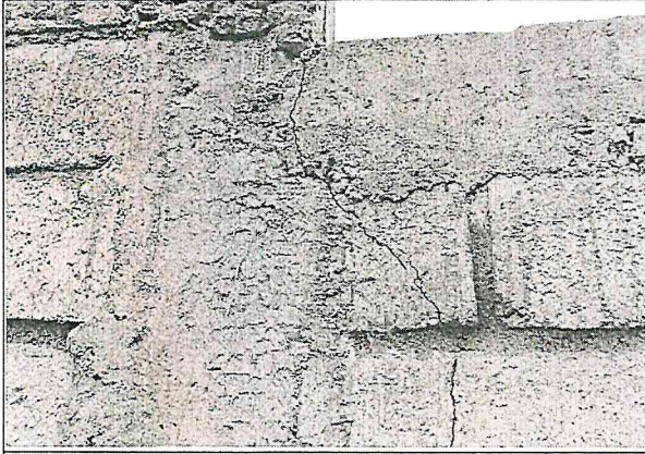
Fisura en el muro frontal del cerramiento, ubicada al costado derecho. El propietario manifiesta que fue una volqueta la que ocasiono el daño.

(registrar Fachada, acceso, pisos, muros, techo, cocina, baño, patio y demás elementos críticos que a futuro deban ser registrados)