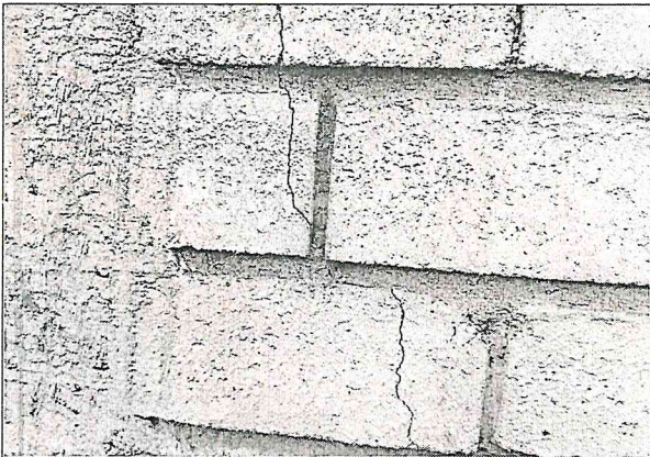
Fisura en el muro frontal del cerramiento, ubicada al costado derecho. El propietario manifiesta que fue una volqueta la que ocasiono el daño.