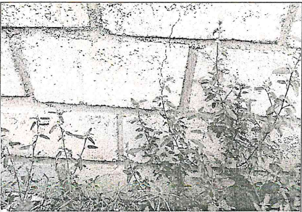
Fisura en el muro frontal del cerramiento, ubicada al costado derecho. El propietario manifiesta que fue una volqueta la que ocasiono el daño.