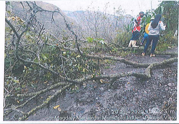
Firma de acta de seguimiento por parte de la propietaria de la finca.