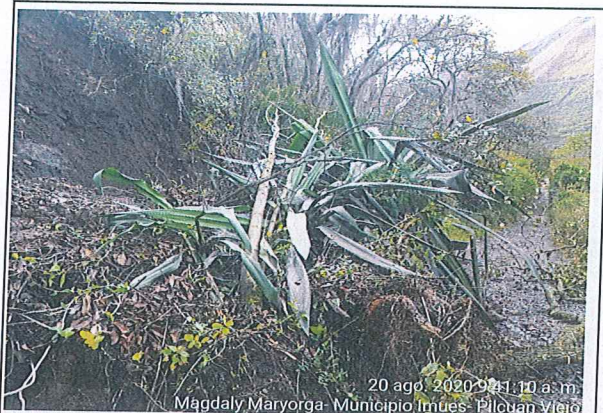
20 ago. 2020 9:41:10 a.m. Magdaly Maryorga- Municipio Imues- Pilcuan Viejo

(registrar Fachada, acceso, pisos, muros, techo, cocina, baño, patio y demás elementos críticos que a futuro deban ser registrados)