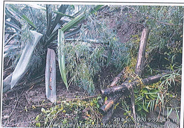
20 ago. 2020 9:39:54 a.m. Magdaly Maryorga- Municipio Imues- Pilcuan Viejo

Desplante de diferentes especies arboreas, obstaculizando la via de acceso a la finca, carretable