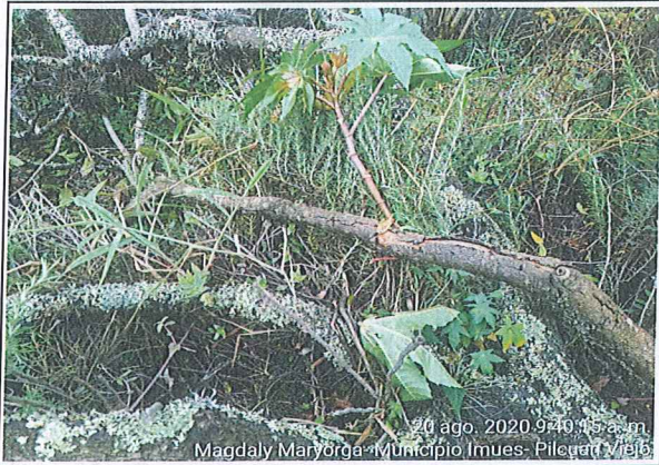
Afectacion una docena de arbustos de romero

(registrar Fachada, acceso, pisos, muros, techo, cocina, baño, patio y demás elementos críticos que a futuro deban ser registrados)