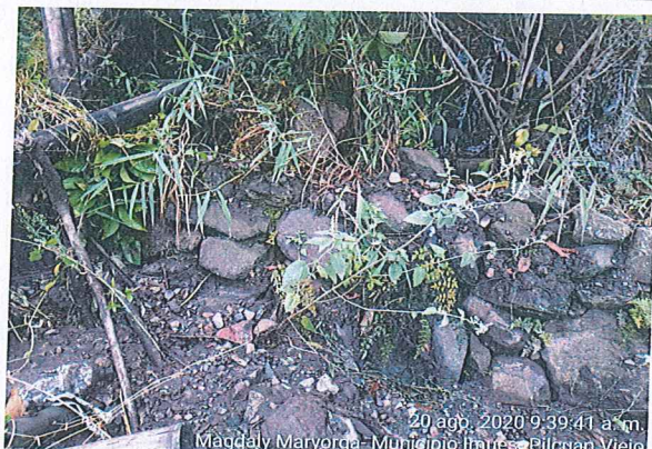
20 ago. 2020 9:39:41 a.m. Magdaly Maryorga- Municipio Imues- Pilcuan Viejo

Daño en muro armado en rocas de longitud aproximada de 12 m por 1.5 metros de alto y 0.40 metros de ancho.