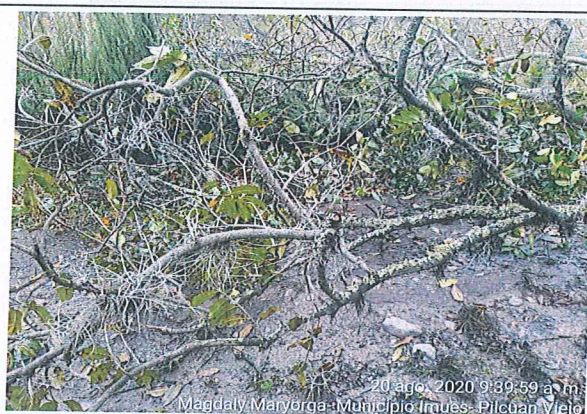
20 ago. 2020 9:39:59 a.m. Magdaly Maryorga- Municipio Imues- Pilcuan Viejo

Vista general de deslizamiento de tiene un area aproximada de 12 m x 8 m