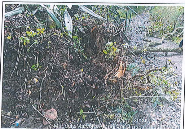
20 ago. 2020 9:41:37 a.m. Magdaly Maryorga- Municipio Imues- Pilcuan Viejo

Desplante de diferentes especies arboreas, debido a deslizamiento generado por alto grado de precipitaciones y escorrentias. 3 guayacanes, 2 acacias, 6 tulipan africanos, 3 agaves gigantes, 4 arbustos camaron rojo 5 plantas de higuerrill, 3 arboles de gualanday y una docena arbustos de romero