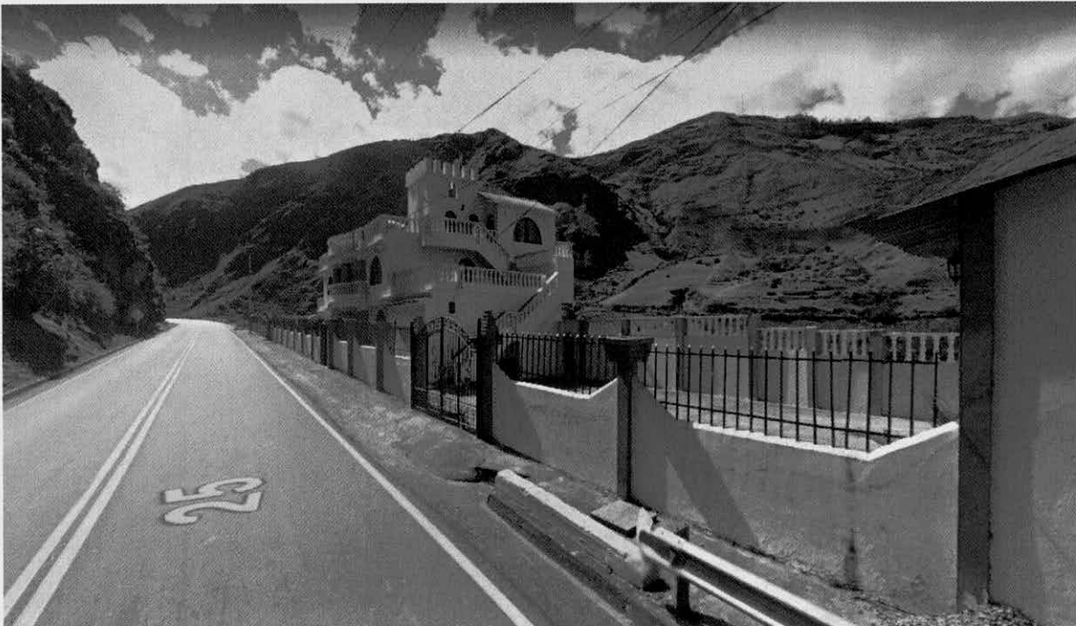
Antes de la ejecución de la vía doble calzada Rumichaca – Pasto