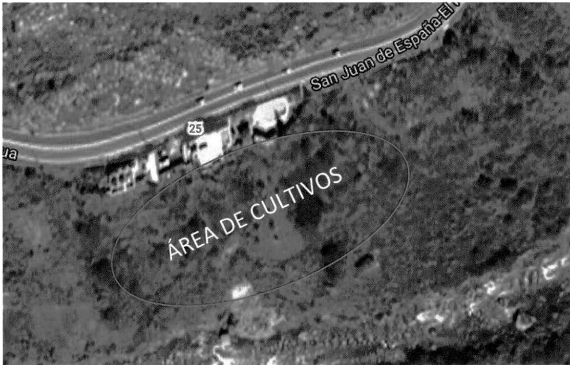
Localización de los cultivos