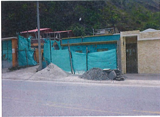
ESTADO ACTUAL DE FACHADA PRINCIPAL DE VIVIENDA, CUBIERTA CON POLISOMBRA CON DESGASTE POR USO Y TIEMPO

(registrar Fachada, acceso, pisos, muros, techo, cocina, baño, patio y demás elementos críticos que a futuro deban ser registrados)