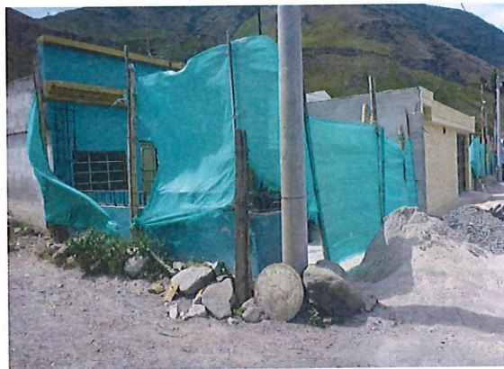
VISTA COSTADO IZQUIERDO DE FACHADA DE VIVIENDA, CON PRESENCIA DE MATERIAL DE CONSTRUCCION SOBRE ANDEN EN CONCRETO, POLISOMBRA CON DESGASTE POR USO Y TIEMPO