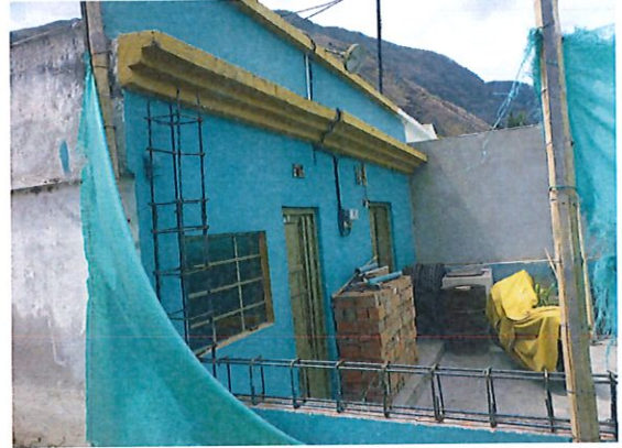
COSTADO IZQUIERDO DE FACHADA DE VIVIENDA EN ESTADO DE CONSTRUCCION