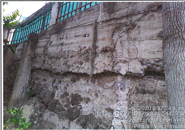
Identificación de muro de cerramiento desde el área interna del predio, el cual presenta múltiples afectaciones debido a las diferentes actividades que se realizan en corte 314. (compactación, corte, transito de maquinaria pesada)

(registrar Fachada, acceso, pisos, muros, techo, cocina, baño, patio y demás elementos críticos que a futuro deban ser registrados)