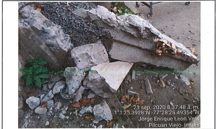
Afectación en columna 2 presenta colapso en su totalidad, se evidencia acumulación de escombros.