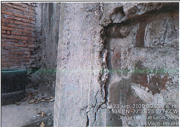
Afectación en columna 1 la cual presenta múltiples grietas y fisuras con desprendimiento de agregados