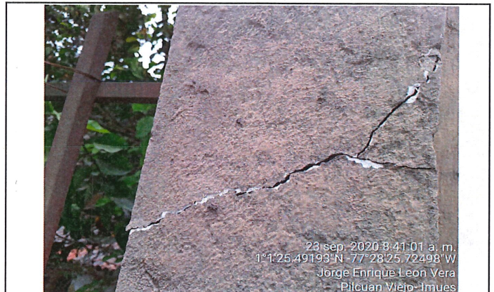
Grietas longitudinales en columna de muro superior de cerramiento.