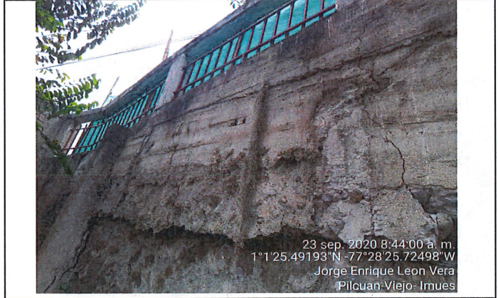
Muro de cerramiento elaborado en roca armada, el cual presenta múltiples grietas de gran envergadura y se encuentra desplazado, en su cara externa presenta acabado en repello.