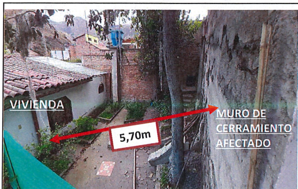
Identificación de distancia entre muro de cerramiento afectado y fachada frontal de la vivienda.