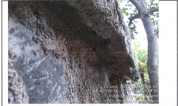
Identificación de desplante y desplazamiento de muro de cerramiento en zona inferior esto es de tipo longitudinal