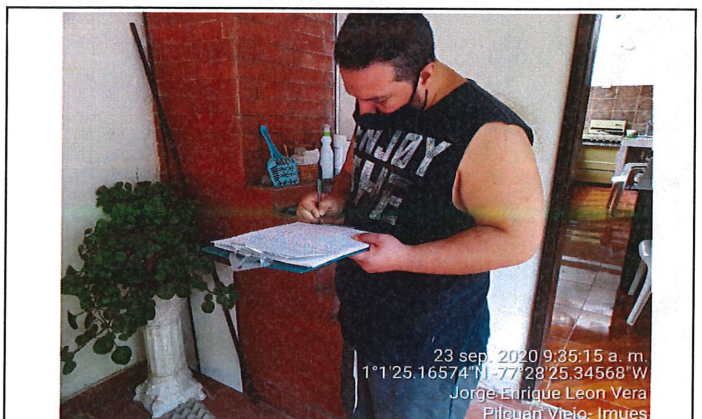
Firma de acta de seguimiento.