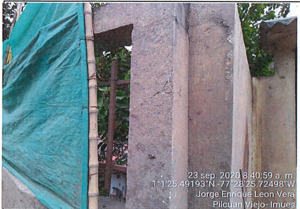
Zona exterior del muro de cerramiento el cual tiene afectación en sus acabados, se observa múltiples grietas transversales y longitudinales.

(registrar Fachada, acceso, pisos, muros, techo, cocina, baño, patio y demás elementos críticos que a futuro deban ser registrados)