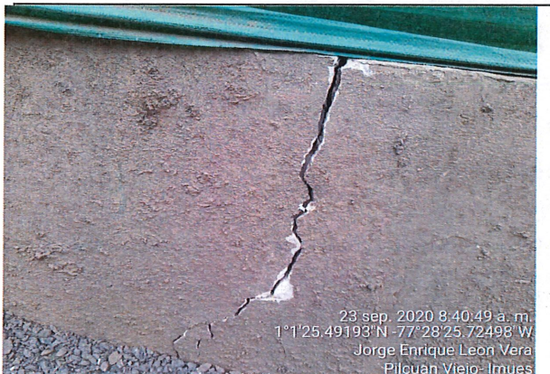
Evidencia de grieta transversal en muro de cerramiento en la zona superior colindante a vía panamericana, cara externa.