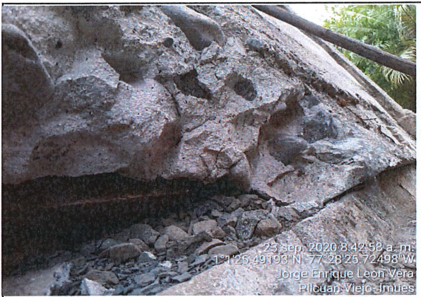
Muro de cerramiento: se encuentra afectado con desprendimiento de agregados en zonas puntuales.