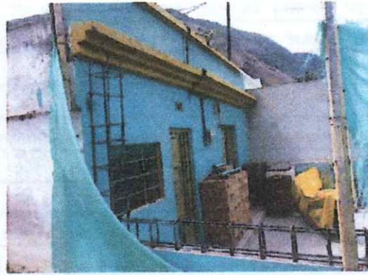
COSTADO IZQUIERDO DE FACHADA DE VIVIENDA EN ESTADO DE CONSTRUCCION