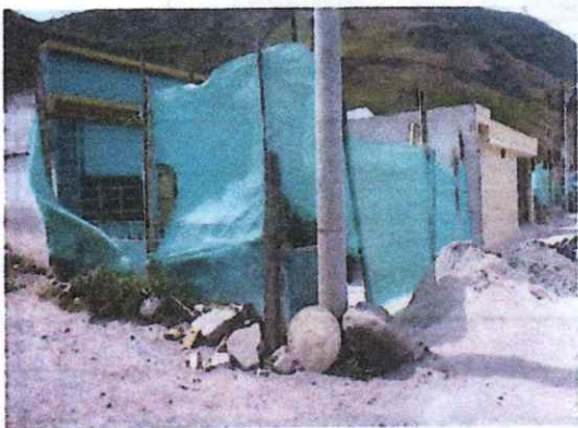
VISTA COSTADO IZQUIERDO DE FACHADA DE VIVIENDA, CON PRESENCIA DE MATERIAL DE CONSTRUCCION SOBRE ANDEN EN CONCRETO, POLISOMBRA CON DESGASTE POR USO Y TIEMPO