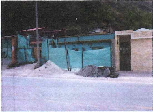
ESTADO ACTUAL DE FACHADA PRINCIPAL DE VIVIENDA, CUBIERTA CON POLISOMBRA CON DESGASTE POR USO Y TIEMPO

(registrar Fachada, acceso, pisos, muros, techo, cocina, baño, patio y demás elementos críticos que a futuro deban ser registrados)