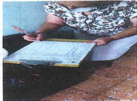
FIRMA DE ACTA DE CIERRE POR PARTE DEL PROPIETARIO